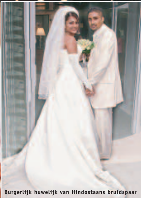
Burgerlijk huwelijk van Hindostaans bruidspaar