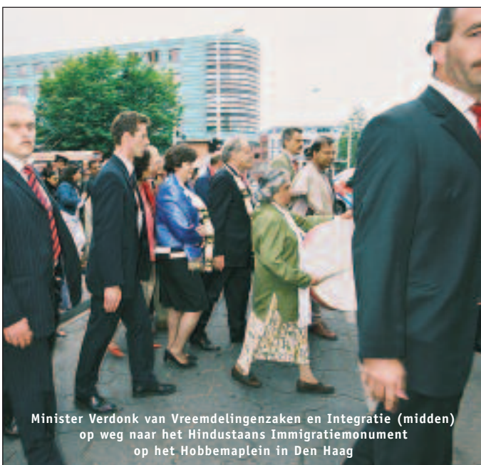
Minister Verdonk van Vreemdelingenzaken en Integratie (midden) op weg naar het Hindostaans Immigratiemonument op het Hobbemaplein in Den Haag

De coöperatieve instelling waarvan het model uitgaat, is ook in lijn met de gedachte van de regering om migranten niet te ‘pamperen’. Deze moeten eigen initiatief tonen en de kansen die de Nederlandse samenleving biedt, niet zonder meer aan zich voorbij laten gaan. Belangrijk is dat de overheid zorgt voor een omgeving, waarin een en ander mogelijk is. Ook al is het een vies woord voor de huidige regering, in de praktijk is er ook nu sprake van integratie met behoud van de eigen cultuur. En zo hoort het ook in een democratische samenleving.